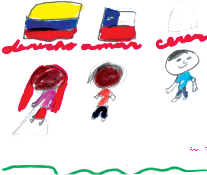
Ana - Colombia - 9 años