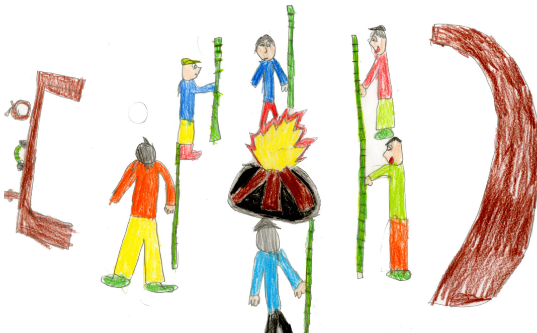
Lientur - Mapuche (Chile) - 9 años -

Mwen gen dwa pou m fè group ansanm ak lòt ti moun ki zanmi m pou n di sa nou panse, oubyen pou nou fete.