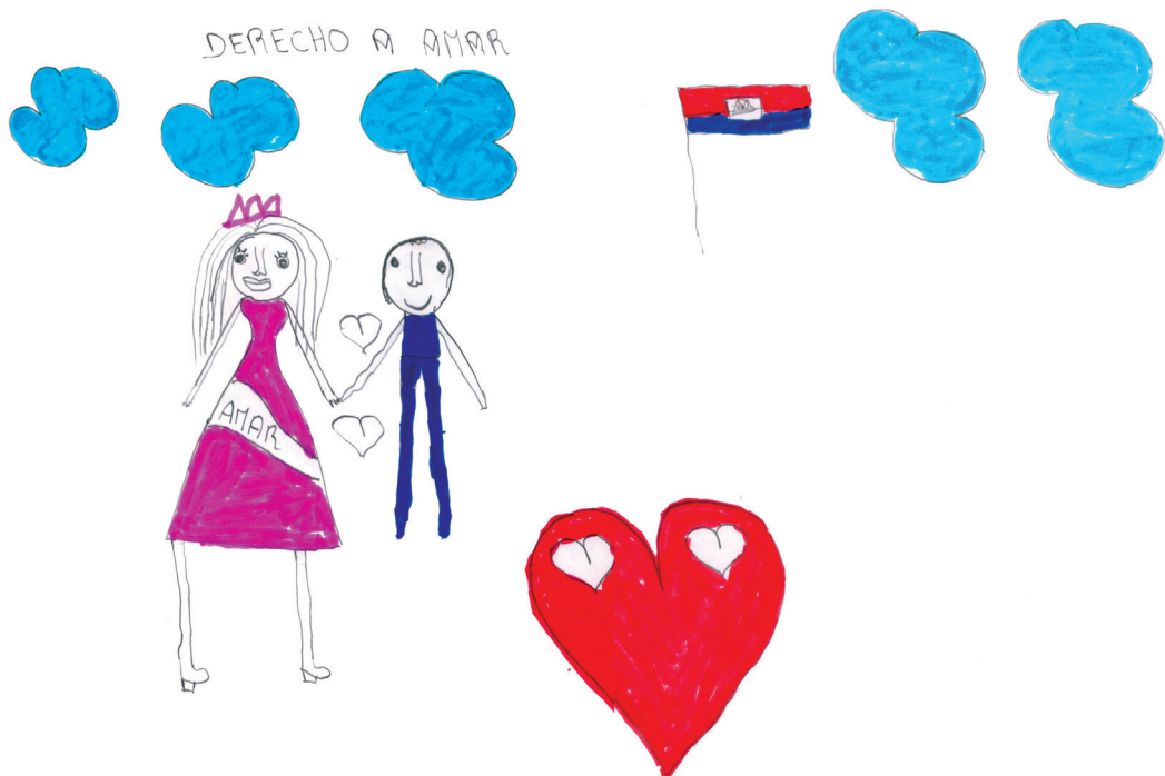
Judly - Haiti - 11 años